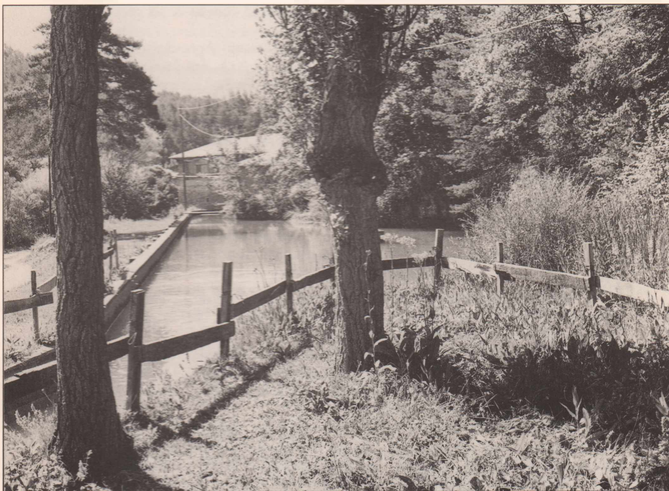
Prat del Monegal, Vall de Lord (Solsonès)