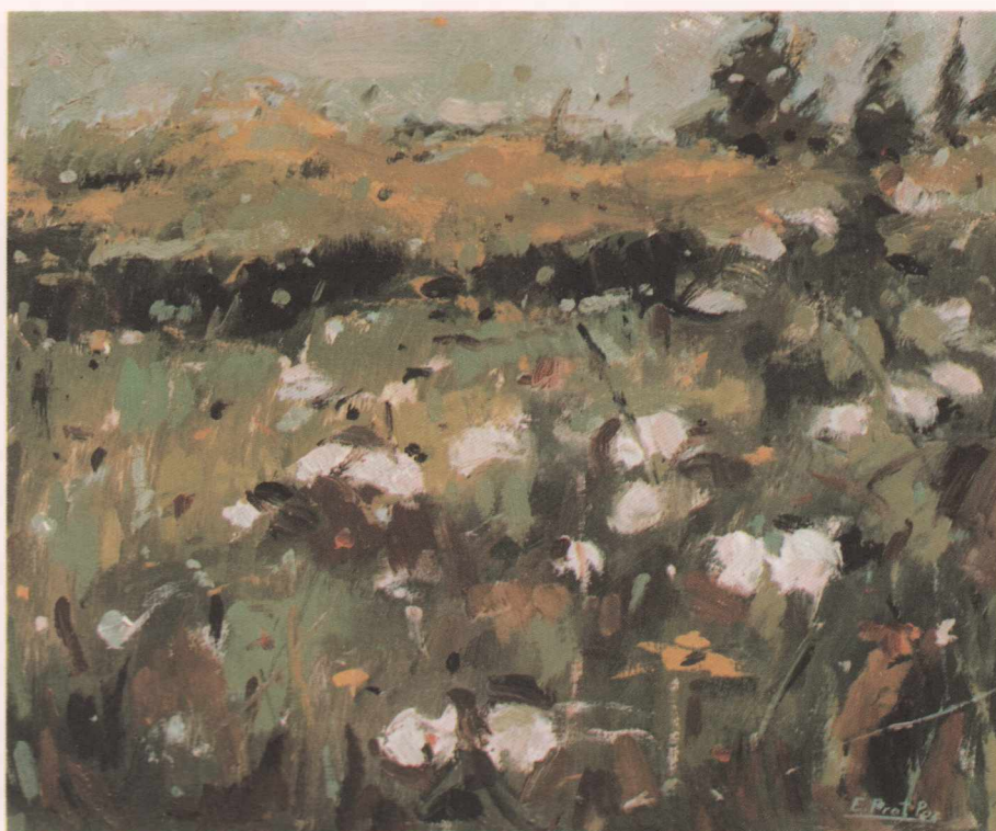
Flors (1992) Oli sobre fusta, 41 x 33 cm.