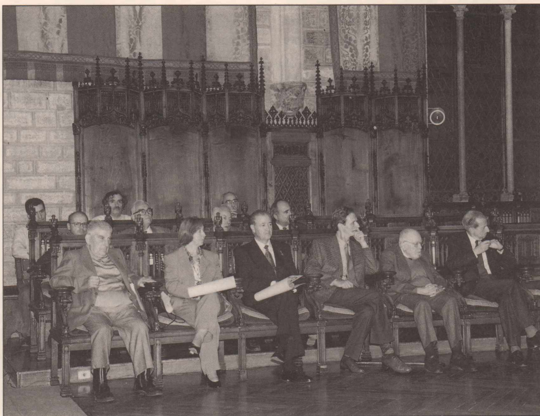
Els sis guanyadors dels XIII Premis d'Actuació Cívica Catalana.

El passat 19 d'octubre va tenir lloc al Saló de Cent de l'Ajuntament de Barcelona l'acte de lliurament dels XIX Premis d'Honor Jaume I a persones i entitats i els XIII Premis d'Actuació Cívica Catalana.