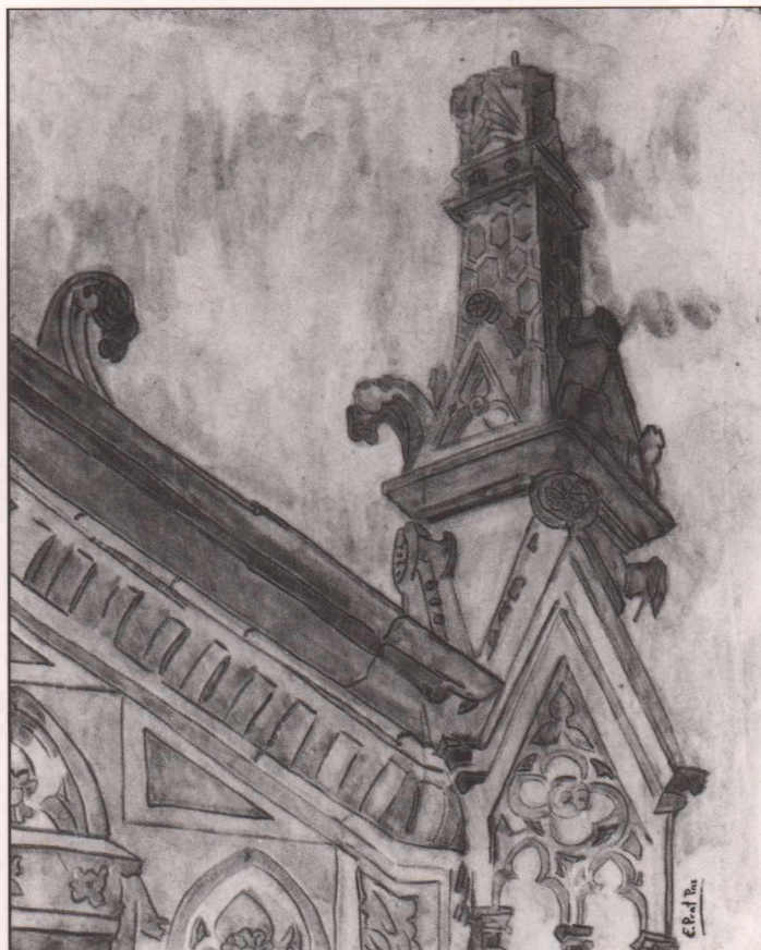
Detall de l'església de Castellar (1987) Pintura al fresc, 32 x 26 cm.