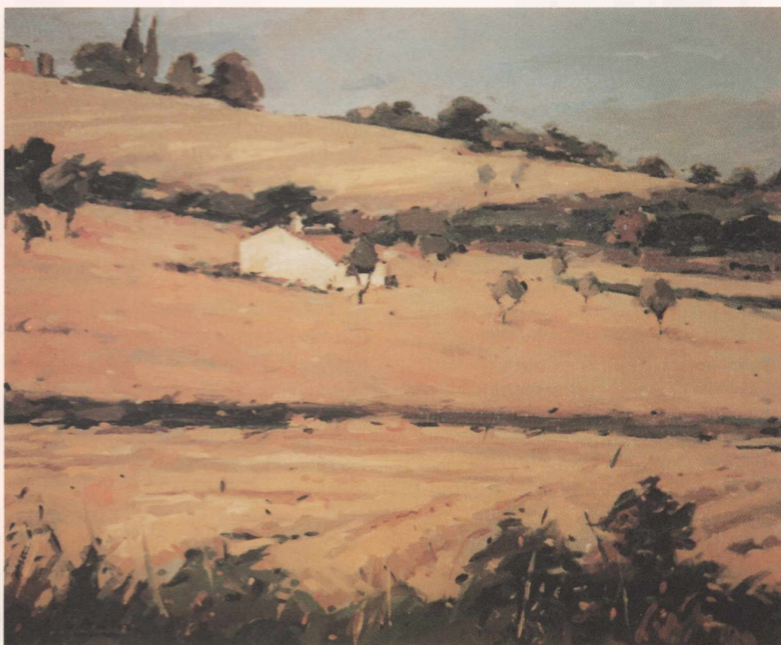
Barraca (1995) Oli sobre tela, 73 x 60 cm