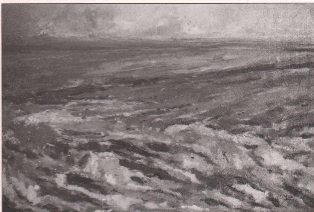
Delta de l'Ebre (1990) Oli sobre tela, 81 x 54 cm.